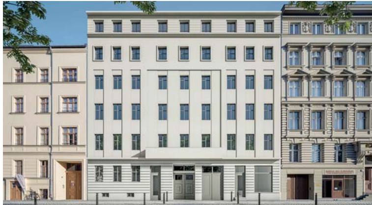
Altbau Ansicht Strasse